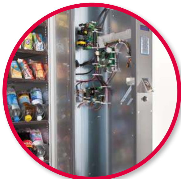
Extractable control panel. Panneau de contrôle amovible.